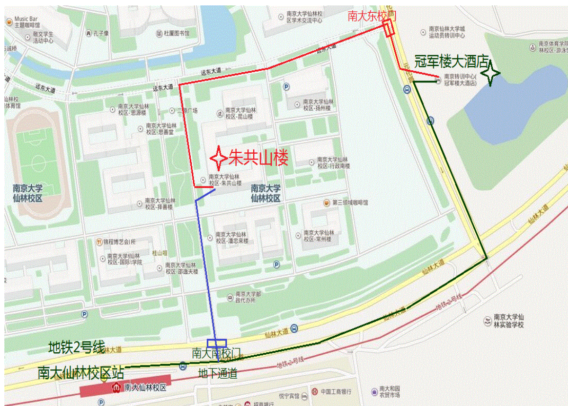
图 1.冠军楼大酒店(仙林大道 169 号江苏省体育局体训中心，南京大学东门)